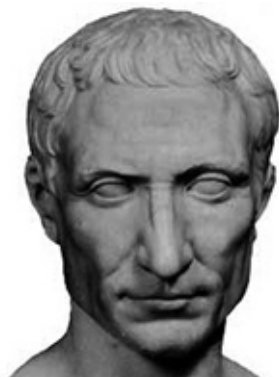
Gaius Iulius Caesar