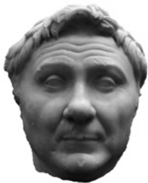
Gnaeus Pompeius Magnus